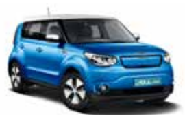
Caribbean Blue & Clear White (AAT)

KIA Motors AG behält sich das Recht vor, jederzeit und ohne vorherige Ankündigung Ausrüstung und Preise ihrer Modelle zu ändern. Bei den technischen Daten handelt es sich um Werksangaben. Irrtum und Druckfehler vorbehalten.