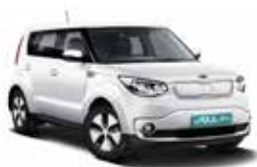
Clear White (1D)