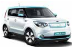
Pearl White & Electronic Blue (ACN)