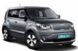
Titanium Silver (IM)