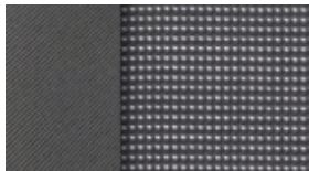
Stoff Reseau Grau