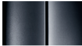
Grau Shark (2)