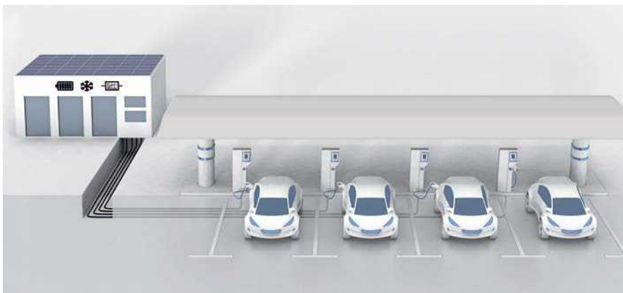
Anwendungsbeispiel 1: Stromtankstelle mit mehreren Ladesäulen

Zur Realisierung Ihrer individuellen Lösung sprechen Sie uns bitte an.