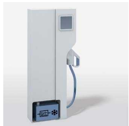
Anwendungsbeispiel 2: autarke Ladesäule