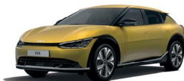
Urban Yellow (UBY) 2 (erst ab Dezember 2021 bestellbar)