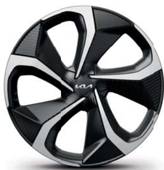
EV6 GT-line (nur in Verbindung mit 77kWh Batterie) Leichtmetallfelgen 20 Zoll mit 255/45 R20 Bereifung