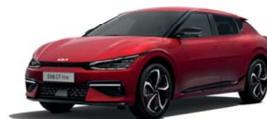
Runway Red (CR5) 2