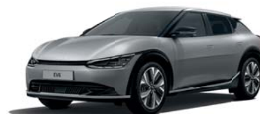
Steel Gray (KLG) 2