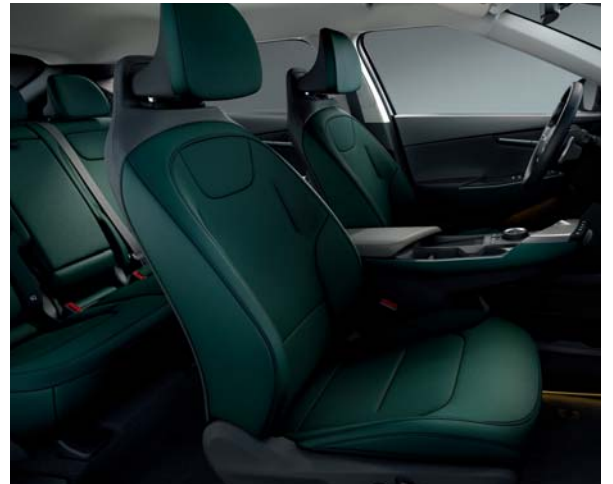
EV6 Air Pro & Premium CGP - Dunkelgrün/Schwarz Sitze aus veganem Leder