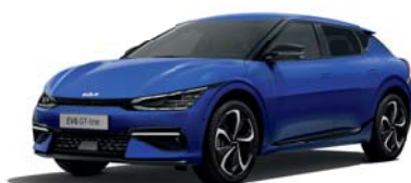
Yacht Blue (DU3) *2