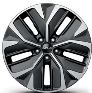
EV6 Leichtmetallfelgen 19 Zoll mit 235/55 R19 Bereifung