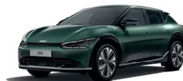
Deep Forest (G4E) 2