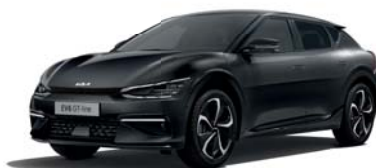
Aurora Black (ABP) 3