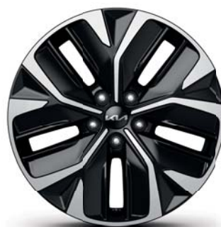
EV6 GT-line (nur in Verbindung mit 58 kWh Batterie) Leichtmetallfelgen 19 Zoll mit 235/55 R19 Bereifung