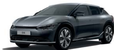
Interstellar Gray (AGT) 2