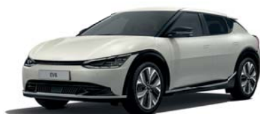
Glacier (GLB) 2