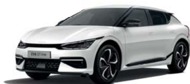
Snow White Pearl (SWP) 3