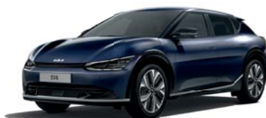
Gravity Blue (B4U) 2