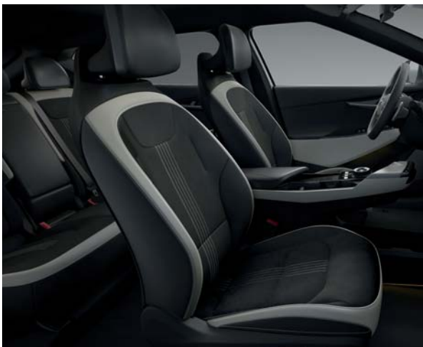
GT-line WK -Schwarz/Weiß Textilsitze