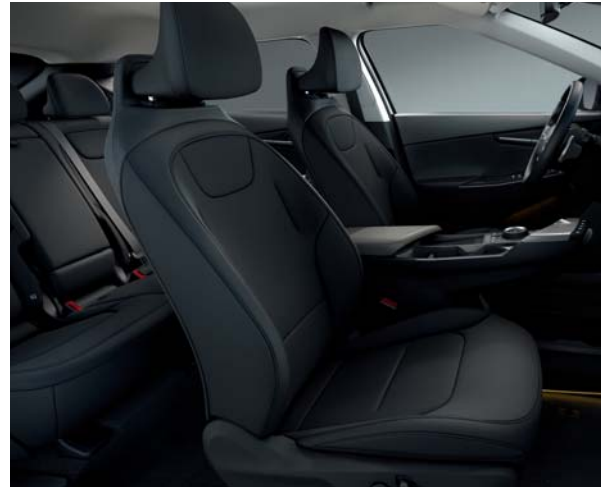
EV6 Air Pro & Premium WK - Schwarz Sitze aus veganem Leder