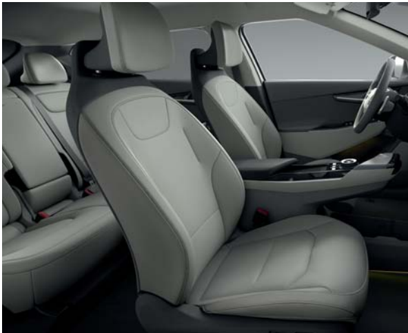
EV6 Air Pro & Premium CVH - Grau/Schwarz Sitze aus veganem Leder