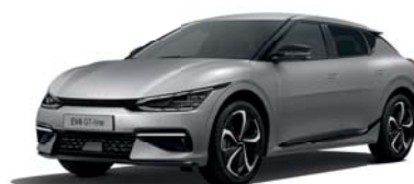
Moonscape Matte (KLM) 3,4