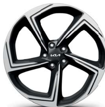
EV6 GT Upgrade Leichtmetallfelgen 21 Zoll mit 255/40 R21 Bereifung