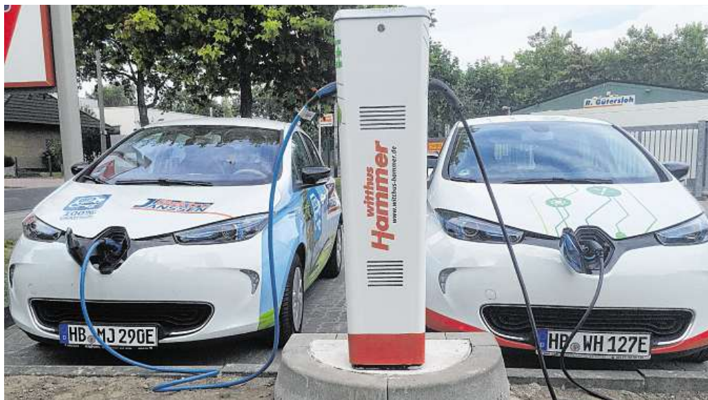
Zwei Elektrofahrzeuge können an der Stromtankstelle bei Witthus-Hammer gleichzeitig beladen werden. Dies bietet Besitzern eines Elektroautos mehr Flexibilität und Freiheit im Alltag. Dennis Witthus, Inhaber des Heimtex-Fachmarktes, möchte mit der Errichtung der Säule diese Form der Mobilität unterstützen und bekannter machen.

Am Donnerstag geht die erste Stromtankstelle im Stadtteil in Betrieb / Barrierefreier und unabhängiger Service für Kunden mit Elektroauto