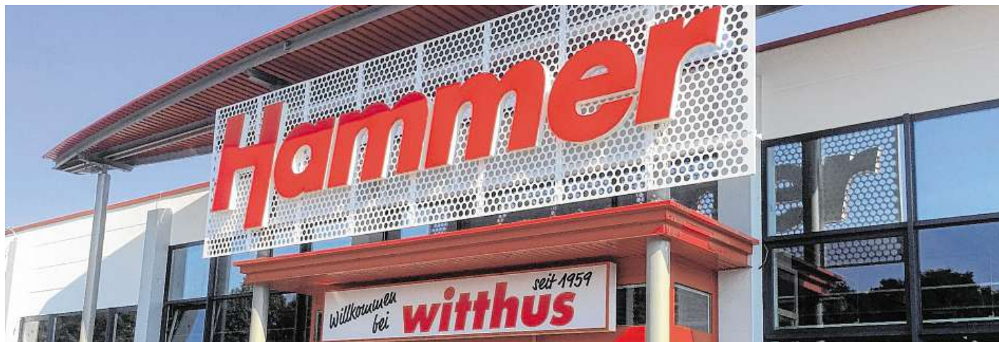
Alles neu, innen wie außen: Bereits die Umgestaltung der Fassade lässt erkennen, dass sich einiges getan hat. All das können Besucher im Rahmen der Eröffnungsfeier an diesem Donnerstag und Freitag entdecken.

Einweihung des umgestalteten Heimtex-Fachmarktes verspricht Aktionen und Musik von maritim bis rockig / „Ladeparty“ an der neuen Stromtankstelle