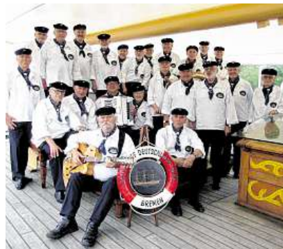
Maritim wird es mit den Shantys und Seefahrerliedern des „Schulschiff Deutschland Chors“.