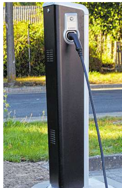
Kurz nach der Installation: Die Ladesäule wartet auf Ihren ersten Probelauf durch Dennis Witthus.