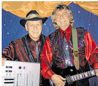
Das „Edan Jope Duo“ sorgt bei der Eröffnungsfeier mit Songs von Oldie bis Country gleich an beiden Tagen für Stimmung.